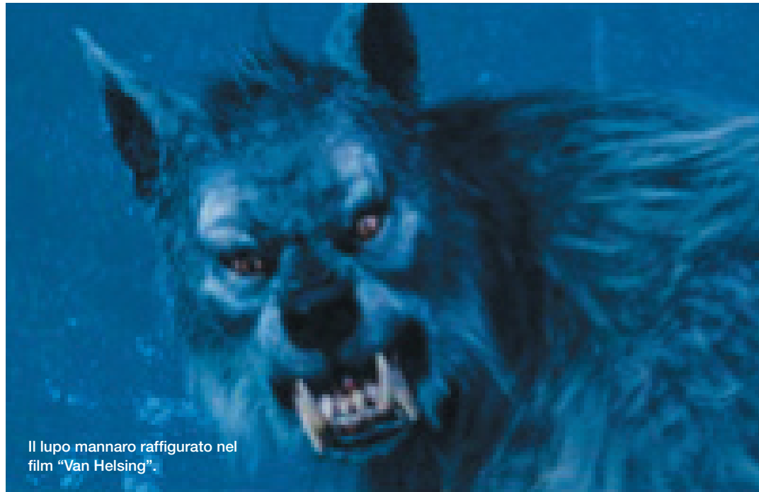
Il lupo mannaro raffigurato nel film “Van Helsing”.

In criminologia, il comportamento che più si avvicina alla figura del licanthropo è il cosiddetto cannibalismo aggressivo, che riflette l'abbandono totale alla natura selvaggia ed impulsiva che risiede sepolta in ciascuno di noi, come retaggio della nostra natura animale. Ecco perché bagnarsi nel sangue della vittima ha un significato primordiale e animale molto profondo, assumendo l'odore, l'identità, il sangue